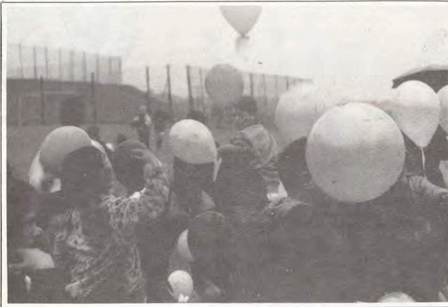
Balwŷns yn cael eu rhyddhau ar 26 Ebrill y tu allan i ddociau Abertawe. Mae cardiau wedi'u hanfon yn ôl o mor bell â Taunton yn Somerset.